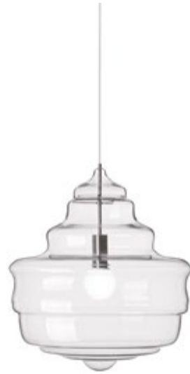
Lustr ze série Neverending Glory Jana Plecháče

Určitě. Myslím, že v této situaci se velmi vyplatí alespoň konzultace, protože designér ukáže na