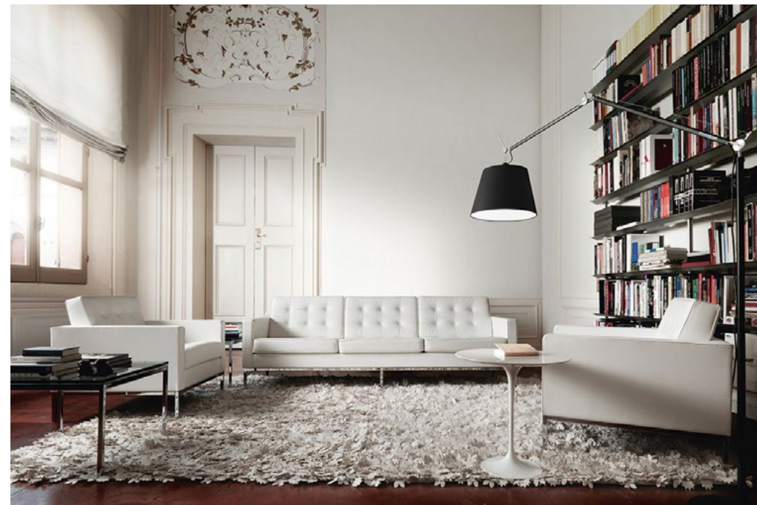
Proměna interiéru bez pomoci odborníka? Riskujete chyby a zbytečně utrácíte peníze