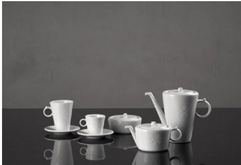
Porcelán ze studia Daniela Piršče